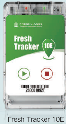
Fresh Tracker 10E