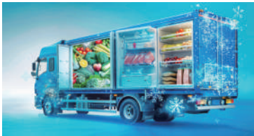
COLD CHAIN TRANSPORTATION

Fresh Tracker 10E는 과일, 식품, 백신, 의약품 및 기타 민감한 제품의 냉장 물류 및 운송 과정에서 원격으로 실시간 환경 모니터링 및 추적을 수행하는 데 이상적입니다.