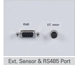
Ext. Sensor &amp; RS485 Port